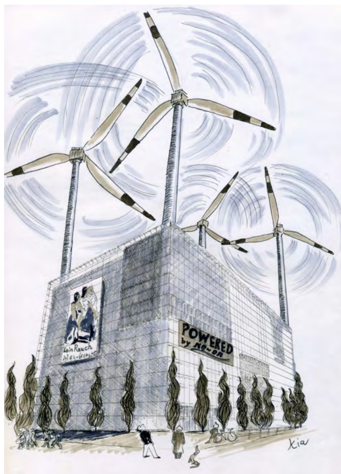
Das CO 2 -neutrale Museum der Zukunft und der Abschied von der Fünften Fassade. Comic: Kia