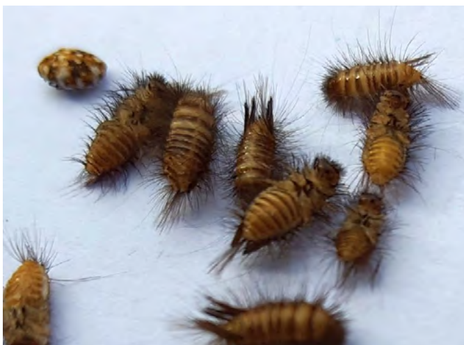
Anthrenus flavipes-Larven, oben links ein adultes Tier. ICM Projekt Marrakesch, Villa Oasis Musée Yves Saint Laurent 2021

Das feuchteregulierte Warmluftverfahren kann in fast allen Fällen und bei fast allen Objekten und Materialien angewendet werden. Die in diversen technischen Merkblättern angegebenen Mindesttemperaturen zur Insektenkontrolle sind teilweise überholt bzw. nie wirklich infrage gestellt worden. Die wissenschaftliche Neugierde und die konservatorische Verantwortung hat ICM dazu