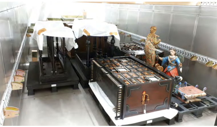
ICM Kammer in Brüssel mit zwei insektenbefallenen flämischen Kabinettschränken, Holz mit Schildpatt furniert, eingelegtes und massives Elfenbein, feuervergoldete Messingbeschläge. Daneben zwei gefaßte Skulpturen.