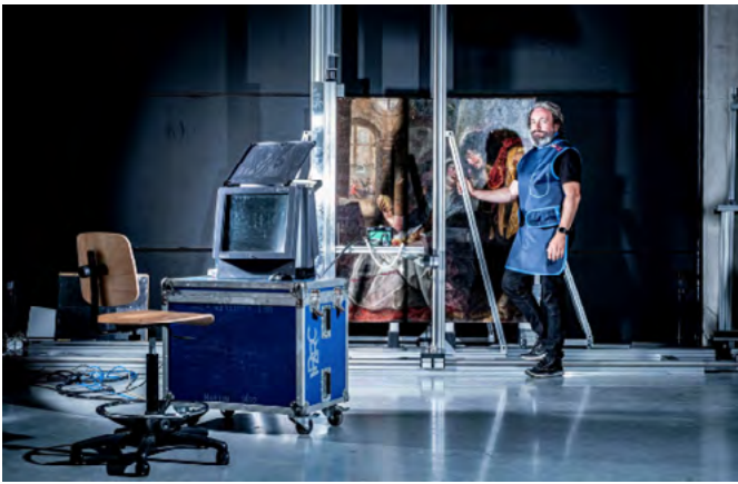
Multispektrale Bildgebung (Röntgen und Makro-RFA) von Gemälden Alter Meister im Brüsseler Labor.