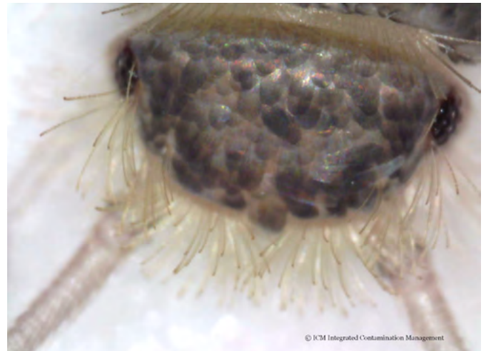
Seit ein paar Jahren viel diskutiert: das sog. Papierfischen ( Ctenolepisma longicaudata )

Die Studienergebnisse werden offiziell bei der (virtuellen) Pest Odyssey Conference 2021 vom 20. – 22. September 2021 vorgestellt werden. 5 Es läßt sich jedoch bereits jetzt festhalten, daß man bei Temperaturen deutlich unter 50 °C erfolgreich behandeln kann.